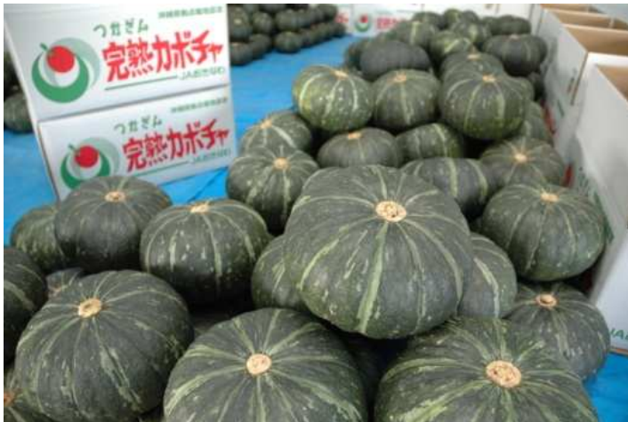
つかざんかぼちゃ