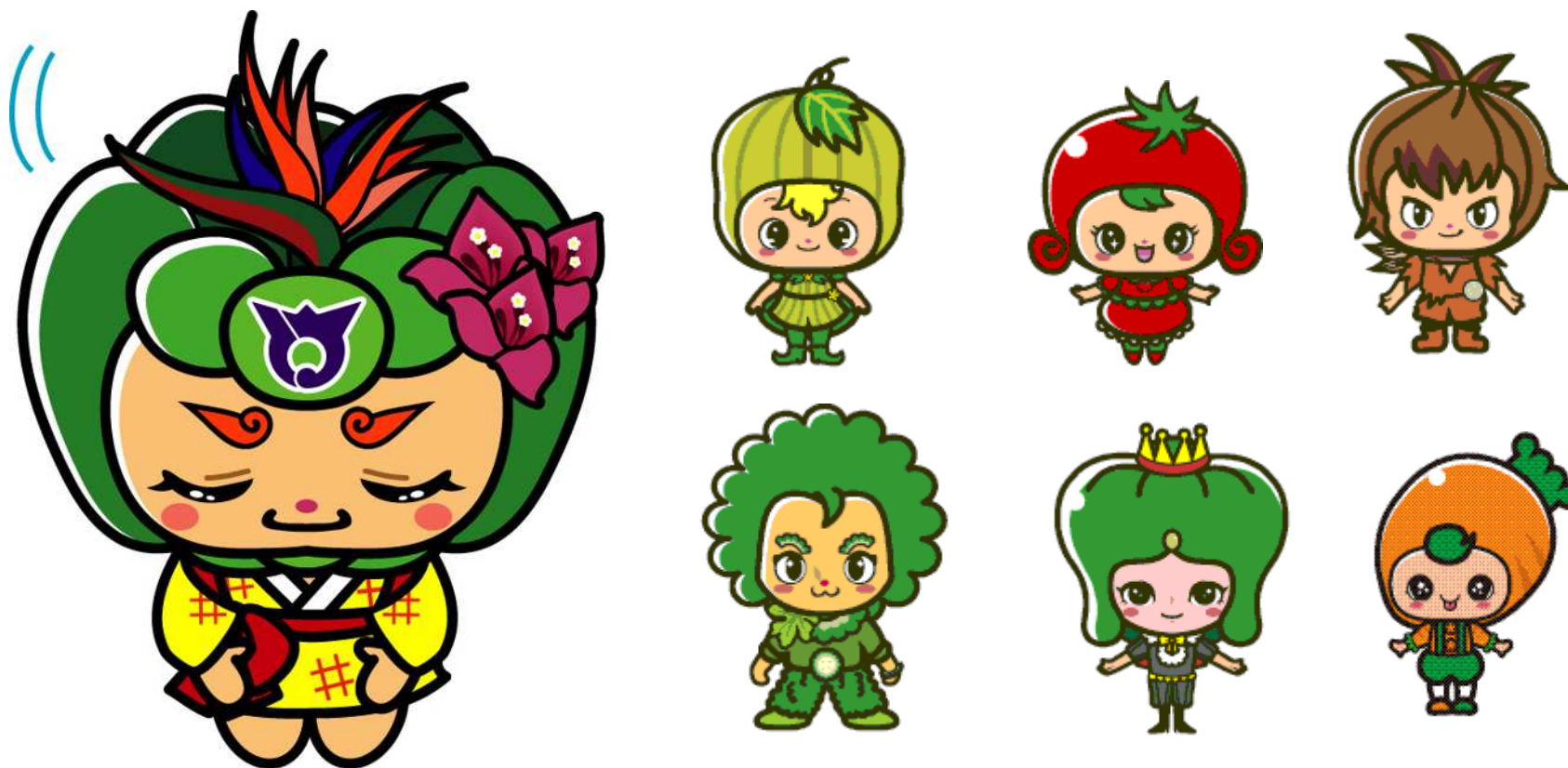
南風原町キャラクター（はえるんと仲間たち）