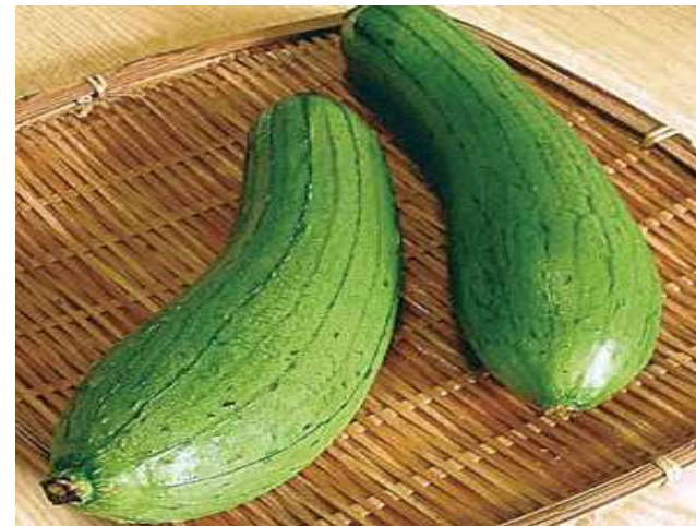
食用へチマの生産日本一